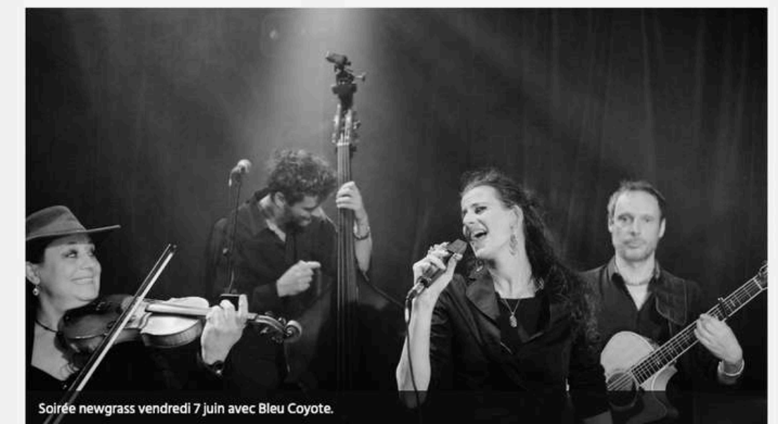
Soirée newgrass vendredi 7 juin avec Bleu Coyote.